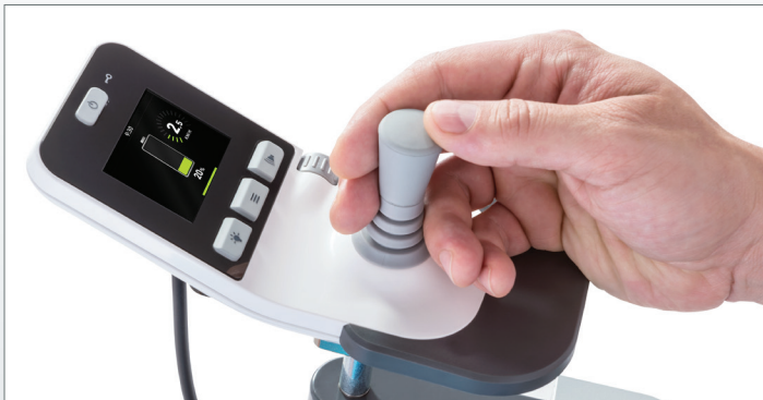
Aussagekräftiges Farbdisplay und benutzerfreundliche Bedienelemente