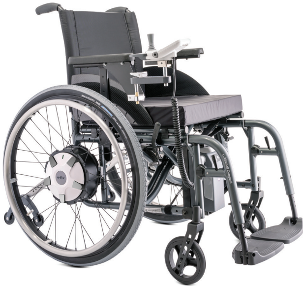
e-fix E36: kraftvolle Antriebsräder mit mehr Leistung (optional)