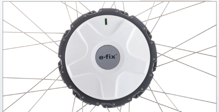
Kompakt, leise, kraftvoll: der e-fix Antrieb